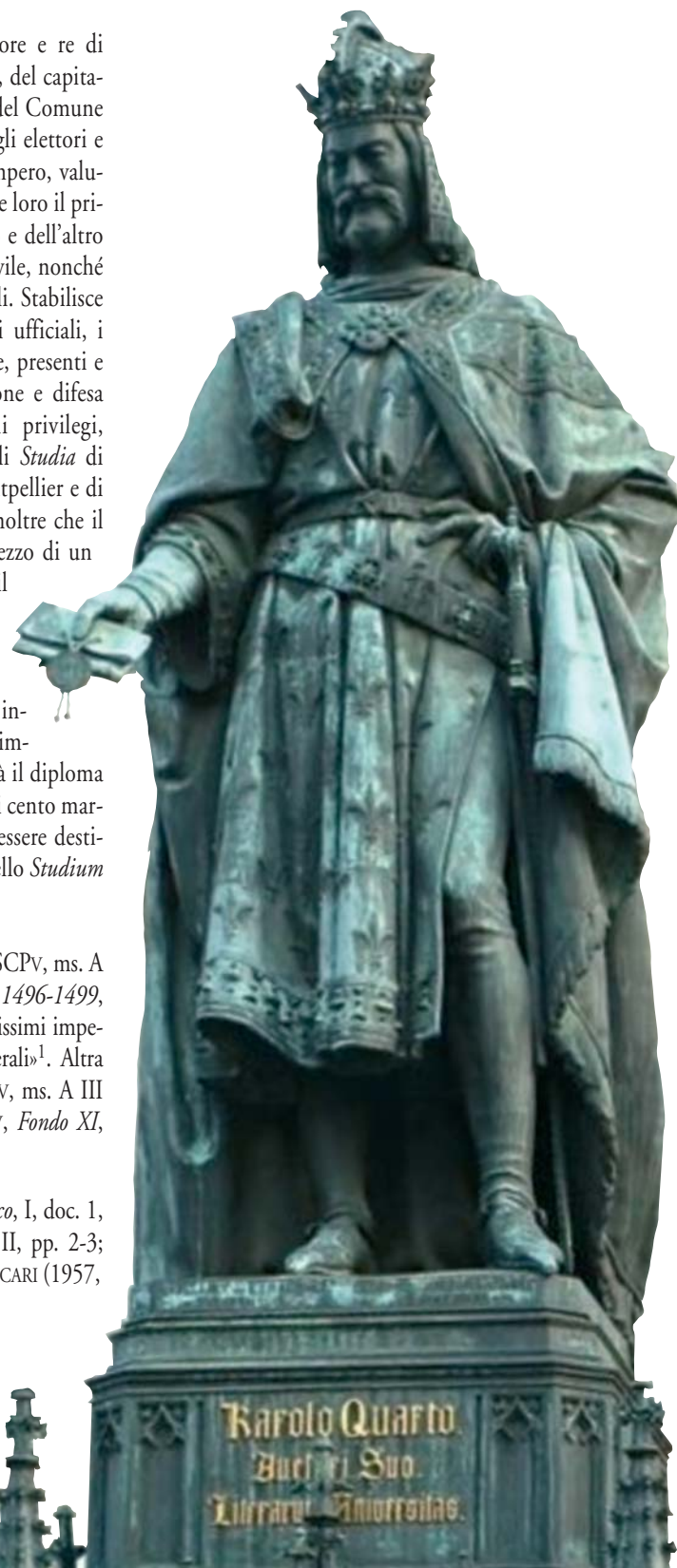
Figura 1 – ARNOST HÄNDEL, Carlo IV di Boemia , 1848. Praga, piazza Křižovnické. La statua è stata eretta per celebrare i 500 anni della fondazione dell'Università di Praga da parte dell'imperatore.